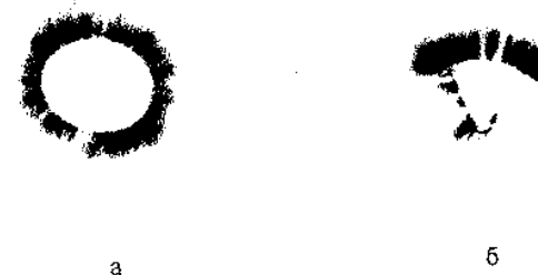
Рис. 1. Фотография свечения: а — на кончиках пальцев, б — на искусственных капиллярах.

В предварительных экспериментах осуществлялось моделирование коронных разрядов по методике Кирлиана на искусственных множественных капиллярах. На рис. 1, а представлена фотография свечения на кончиках пальцев; на рис. 1, б — фотография, полученная в модельных экспериментах для 10 капилляров из полиметилметакрилата с внутренним диаметром 50 мкм, наполненных водным раствором NaCl с весовой концентрацией 0.3%. Обе фотографии выполнены по методике Кирлиана. В этих экспериментах не было